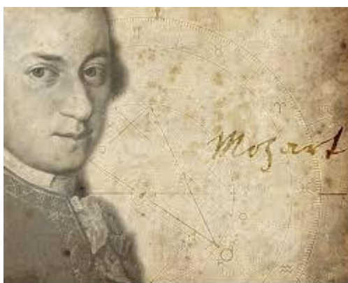
Wolfgang Amedeus Mozart